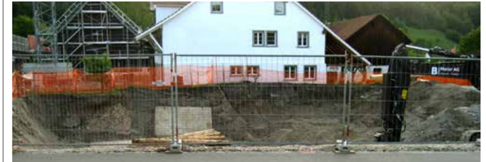
Nein, das war keine russische Rakete. Das war die Geldgier eines Milliardenkonzerns, der sich zwar als «Genossenschaft» bezeichnet, dessen Leitung aber rücksichtslos seine eigene Geschichte zerstört.

Hier an der der Dorfstrasse 1 in Embrach standen fast ein Jahrhundert lang der VOLG und die Milchhütte von Embrach, der ganze Stolz der Embracher Bauern. Kaum übernimmt die Landi Züri Unterland, wird alles abgerissen, obwohl alles bestens erhalten war.