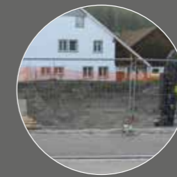
NEUES AUS EMBRACH