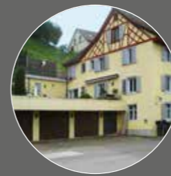
DAS EHEMALIGE KRANKENASYL RORBAS