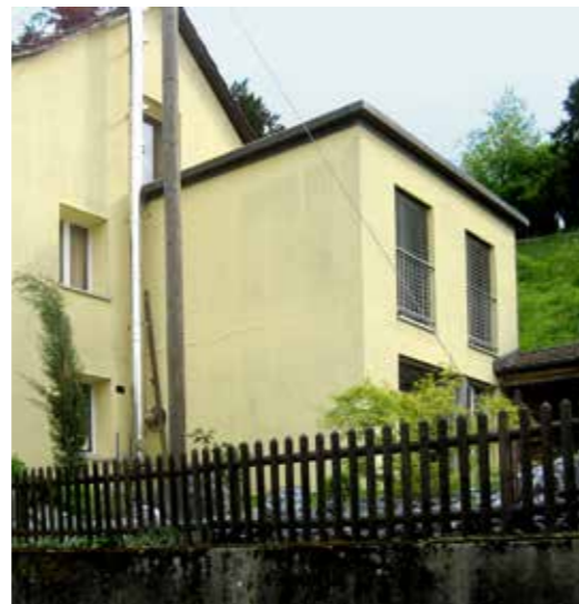
Der westliche Anbau ist der ehemalige Operationsaal

in Rorbas operiert habe (Anmerkung: Das dürfte eine reine Legende sein, weil Dr. Ferdinand Sauerbruch mit Ausbruch des 1. Weltkriegs nach Deutschland zurückkehrte und ab den dreissiger Jahren, soweit bekannt, nicht mehr in der Schweiz tätig war).