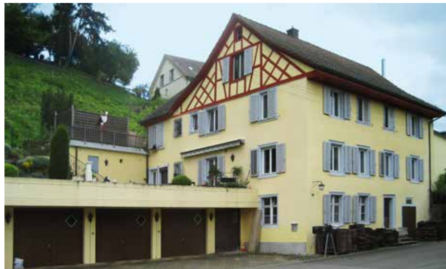
Weissenhaldenstrasse 12 in Rorbas heute. Das ehemalige Krankenasyl.

Als mein Mann die Praxis übernommen hatte, wurden die Laborarbeiten in der Praxis durchgeführt, da ich Laborantin von Beruf bin.