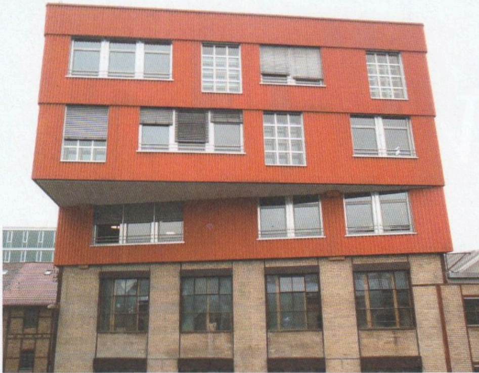
Ein Leuchtturm für nachhaltiges Bauen: Das Projekt K. 118 in Winterthur.